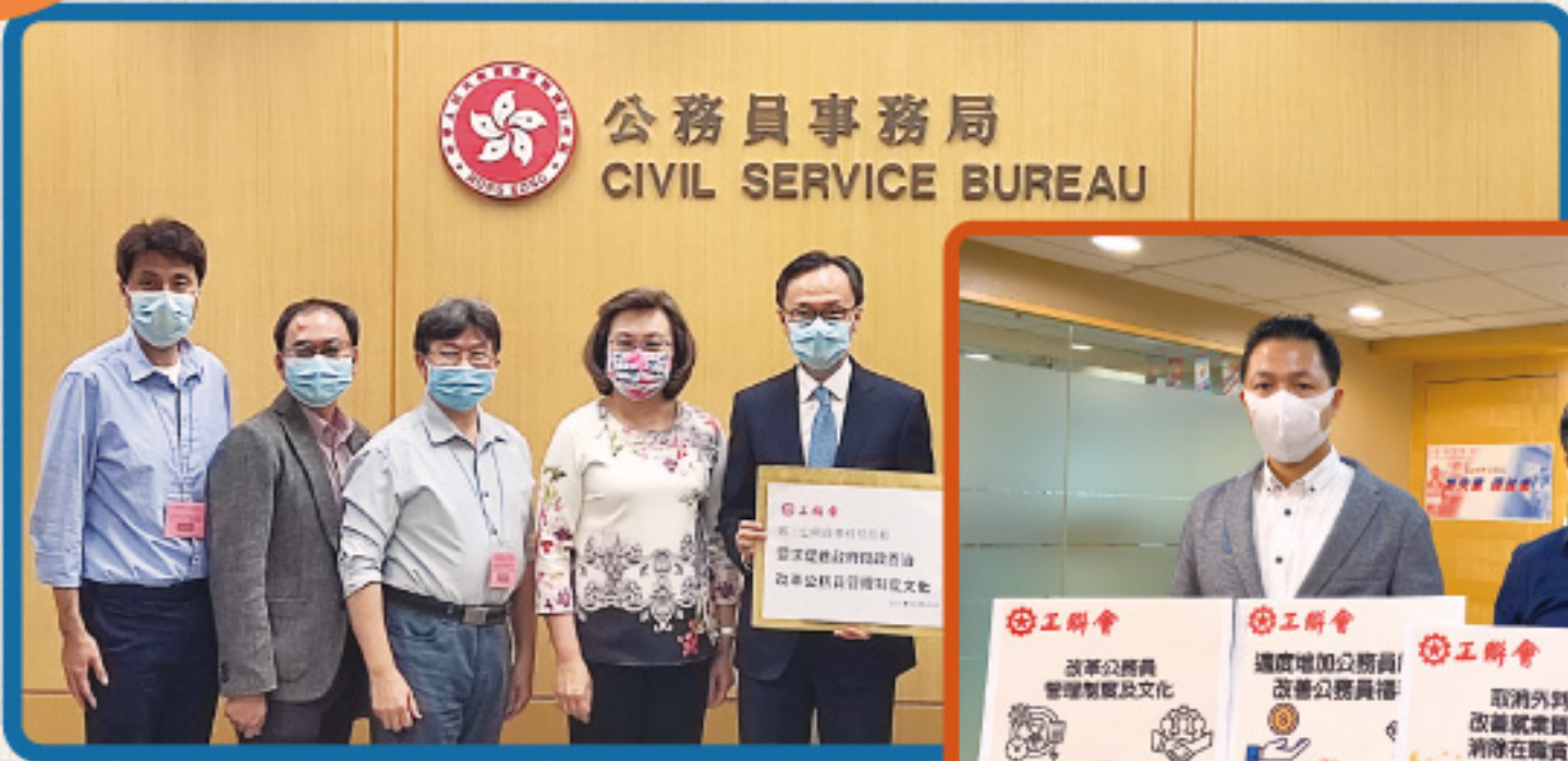
▲ 2021年10月25日約見公務員事務局局長聶德權