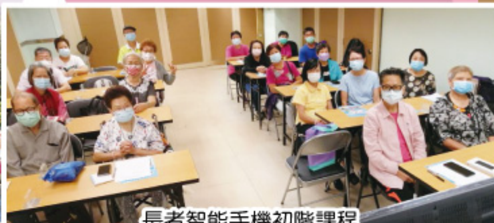
長者智能手機初階課程