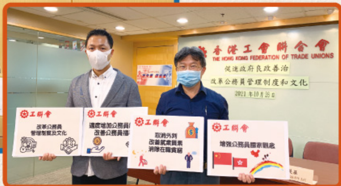
▲ 2021年10月26日舉行記者會