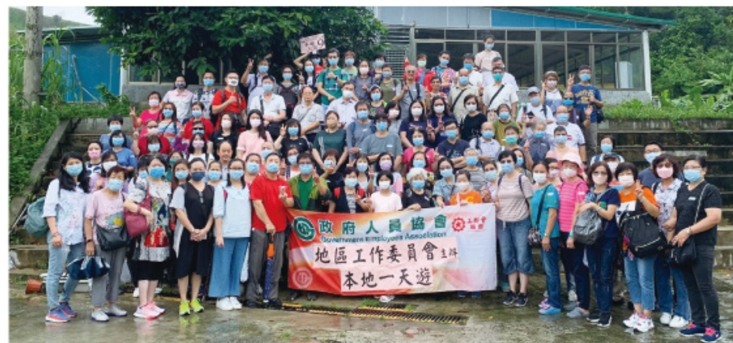
2021年9月24日慶祝國慶「本地一天遊活動」

本會藉著國慶期間於2021年10月10日舉辦「天空之鏡、火龍果農莊、元朗私房菜一天遊」活動，參加的會員及家屬約280人。其中「天空之鏡·流水嚮」景點對工會有特殊意義，於二十多年前曾獲漁護署批出一幅地，作工會慶祝香港回歸植樹之用。